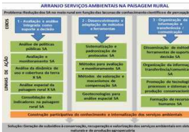
Figura 2. Principais eixos e linhas de pesquisa abordados no Arranjo de Projetos: Serviços Ambientais na Paisagem Rural (Arranjo SA). Elaborada pelos autores.